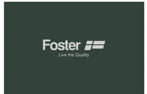
Kohlefilter-Kit 9700 221