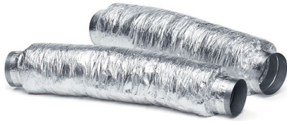
Kanalisation flex schalldämpfend Ø 120 9700 602